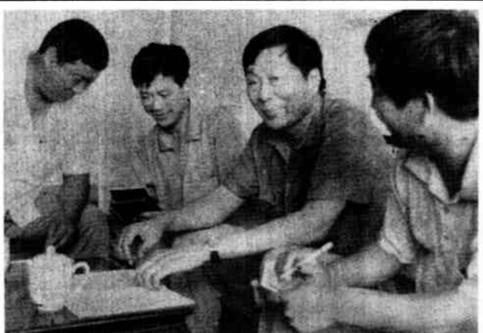
河口区农业技术人员在田间指导农民进行蔬菜生产。

区利用草场54万亩，发展畜牧业生产专业村10个，并抓住靠海优势，发展海洋渔业和淡水渔业，全区建成鱼塘达140余处，渔业专业户450户，从而极大地丰富了城乡居民的菜篮子。该区还注重沟通蔬菜销售渠道。他们在三个城区兴办了蔬菜早市，抓好蔬菜批发调剂，减少了中间环节抑制物价工作。目前，全区各类市场十分活跃，年成交额达1.2亿元。在抓好“菜篮子”基础上，这个区借“两黄”农业开发之机，大力发展“双高一农业”，利用已开发的高标准农田和水利设施，引导农民从事棉、豆、谷、大米、油菜等经济作物的种植，从而提高了农业生产整体效益。同时，也探索出了一个适合河口区实际的开发路子。（李寿璞）